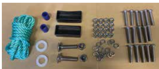
Deler 4 trinn