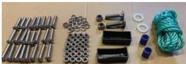
Deler 6 trinn